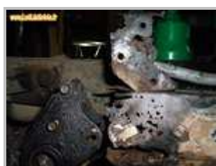
5 => Longerons arrière : corrosion perforante au niveau des fixations du train arrière (merci Foxclan pour la photo... et bon courage 😊)