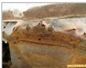
1 => traverse avant : corrosion du support de boite de vitesse