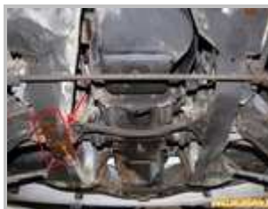
2 => Brancards avant : corrosion perforante