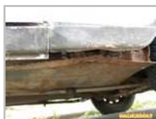
4 => Longerons avant : corrosion perforante au niveau des supports de cric (très courant)