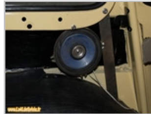
Enceinte fixée sur la 1ère plaque