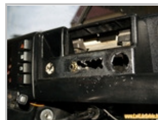
Découpe pour l'horloge