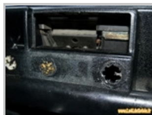
Découpe pour l'allume-cigare