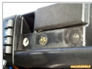
Traces de colle -argh-

Après avoir bien réfléchi à la manière de positionner l'un et l'autre, je suis passé à la découpe du tableau de bord à l'aide d'un perceuse, d'une dremel et d'un ciseau à bois. L'allume cigare sera donc à droite car placé plus à gauche il aurait touché le moteur d'essuie glace, ce qui aurait fait un belle masse, la pendule au milieu et à gauche. Pour cacher la dernière marque de colle, je poserai un petit panneau "Attachez vos ceintures" en plastique que j'ai restauré.