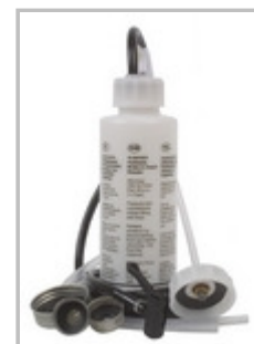
Purgeur automatique "EeziBleed"

Je décris dans cet article comment j'ai réalisé moi-même ce système pour 7€50. Bien sûr, mon matériel de récup est plus ou moins spécifique et pas forcément disponible pour tout le monde, après c'est du système D pour adapter le montage en fonction du matériel à disposition. Pour la réalisation de mon montage j'ai juste du acheté un pulvérisateur de jardin premier prix pour 7€50 et le reste ne m'a rien coûté.