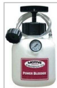
Purgeur automatique "Power Bleeder"

Ce genre d'appareil existe dans le commerce pour la somme d'environ 70€ pour le Power Bleeder™ ou 30€ pour le EeziBleed™, ce qui fait cher payé alors qu'avec un peu de récup et de bricolage il est très facile de s'en faire un soi-même pour presque rien.