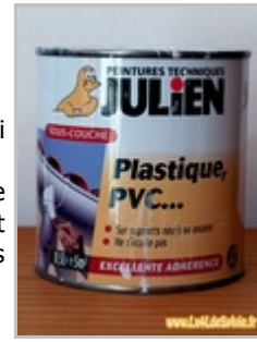
Sous-couche en pot

Pour les plastiques qui ne sont pas lisses à l'origine comme le plastique du toit je n'ai pas pu poncer à cause du texturage : après l'avoir bien nettoyé au Kärcher, je l'ai donc brossé avec une brosse en plastique pas trop abrasive. La couche d'apprêt a quant à elle été faite au pinceau avec un pot de peinture spéciale sous-couche plastique. La teinte finale est obtenue par plusieurs couches de peinture en bombe.