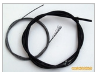
Câble et gaine au mètre