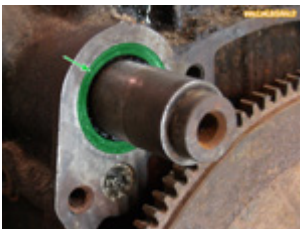
Joint spi Cléon

Le joint d'étanchéité (joint spi) de l'arbre à cames est au niveau de la poulie d'entraînement de la courroie de pompe à eau. Lorsqu'il n'est plus étanche l'huile moteur fuit (relativement lentement) et est projeté par la poulie d'entraînement. Je n'ai pas de photo pour illustrer le problème mais si la base de la poulie est très grasse, c'est sûrement qu'il y a un loup de ce côté là.