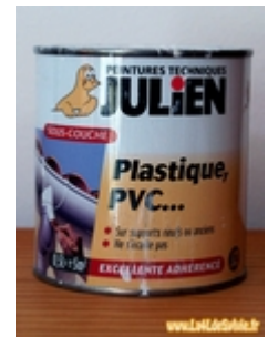
Sous-couche en pot

Pour conclure je dirai que je m'en suis bien sorti mais cette méthode ne marchera pas forcément sur tous les plastiques. Il est par exemple très difficile (impossible) de trouver un apprêt pour du polypropylène.