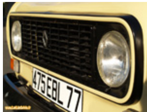
Calandre en plastique