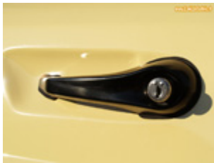
Poignée de porte