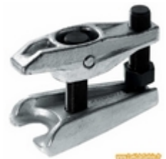
Arrache rotule Facom

Il est bien sûr possible d'extraire une rotule sans arrache rotule (bombe de froid, coup de masse,...) mais un bon arrache rotule, c'est tellement plus simple et finalement vite amorti car il est nécessaire dans la plupart des opérations sur les trains avant.