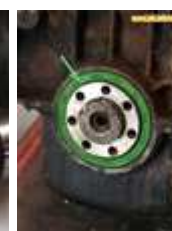
Joint spi Cléon