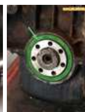
Joint spi Cléon